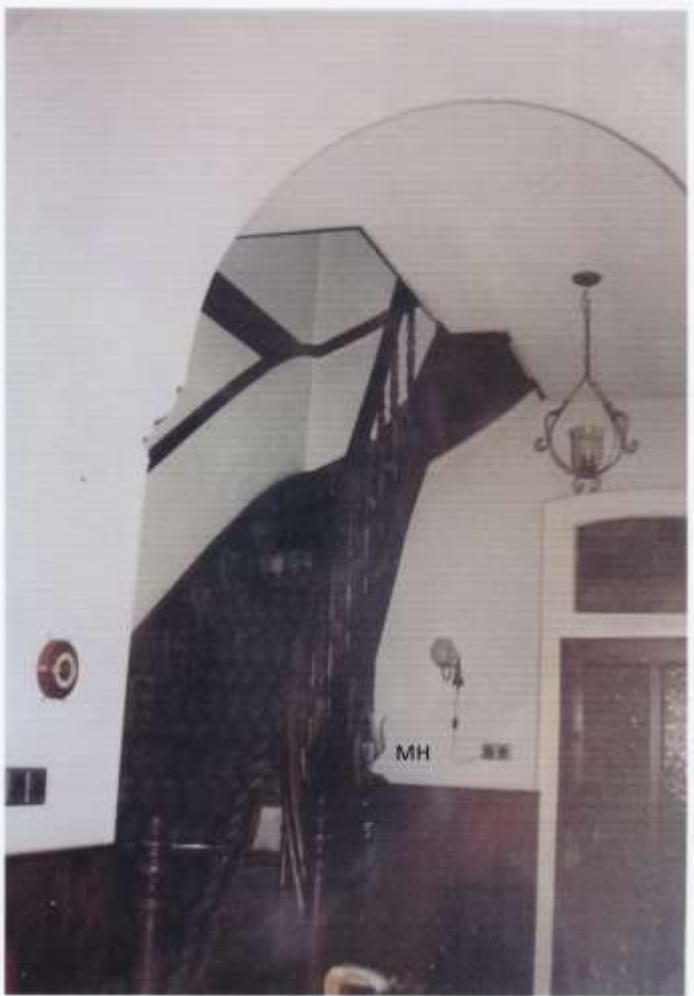
De Hal van het woonhuis.