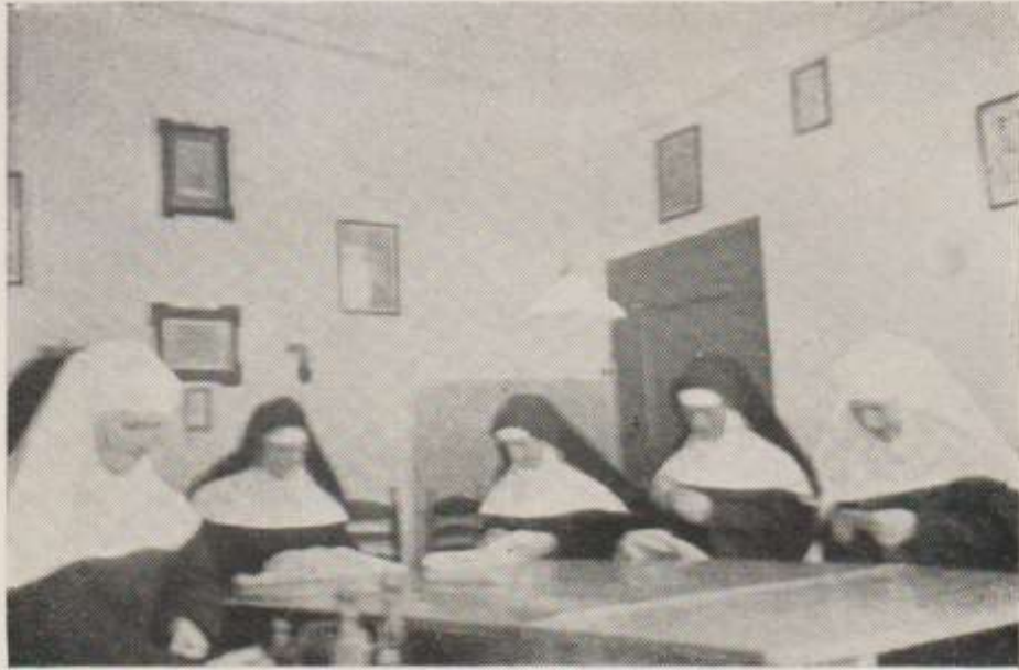
RECREATIE EN ARBEID